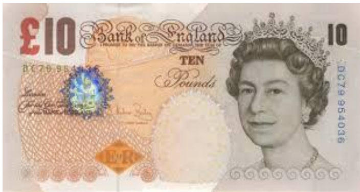
Фунт – денежная единица Великобритании